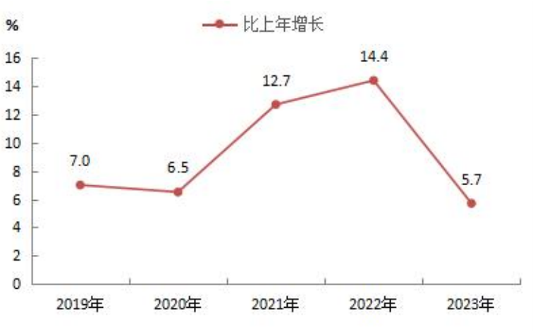
图 3 2019-2023 年规模以上工业增加值增长速度

全县规模以上工业中，传统行业增加值比上年增长 3.8%，非传统行业增加值增长 12.5 %。分三大门类看，全年全县采矿业增加值比上年下降 13.4%，占规上工业增加值比重为 12.6%；制造业增加值增长 8.9%，占规上工业增加值比重为 84.3%；电力、热力、燃气及水生产和供应业增加值增长 3.9%，占规上工业增加值比重为 3.1%。分经济类型看，国有控股企业增加值比上年增长 4.5 %，私人控股企业增长 8.7%。分企业规模看，大型企业工业增加值增长 6.9%，中型企业下降 12.2%，小型企业增长 11.1%。