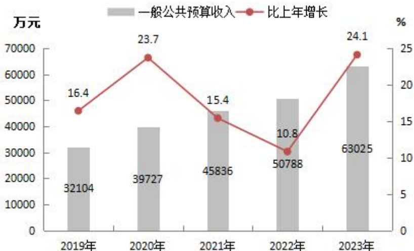
图 6 2019-2023 年一般公共预算收入及其增长速度

一般公共预算支出 281265 万元，比上年增长 15.8%。其中，民生支出 231764 万元，增长 15.2%。一般公共服务支出 27616 万元，增长 10.7%；公共安全支出 6968 万元，下降 5.1%；教育支出 53343 万元，增长 12.4%；社会保障和就业支出 50827 万元，增长 6.7%；卫生健康支出 21191 万元，增长 0.9%；农林水事务