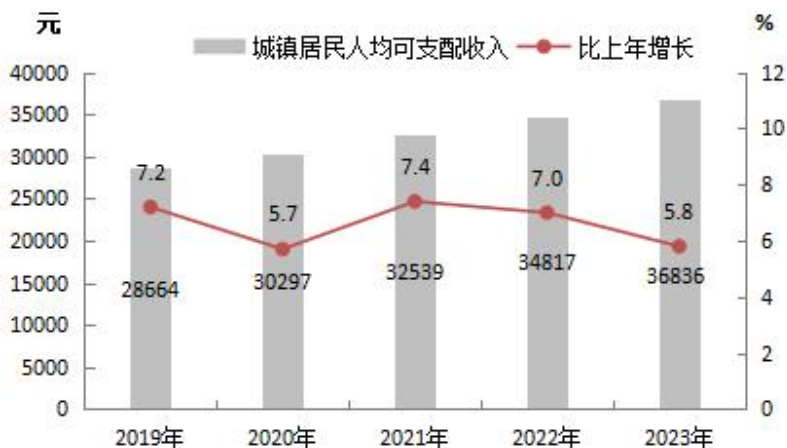
图 7 2019-2023 年城镇居民人均可支配收入及其增长速度

全县全年居民人均可支配收入 24908 元，比上年增长 7.3%。其中：城镇居民人均可支配收入 36836 元，比上年增长 5.8%；城镇居民人均消费支出 20997 元，比上年增长 12.5%；农村居民人均可支配收入 13059 元，比上年增长 10.6%；农村居民人均生活消费支出 10801 元，比上年增长 13.7%。