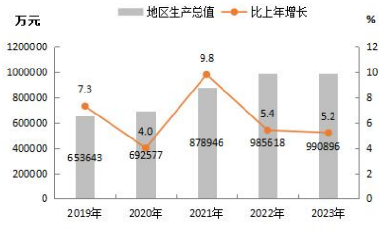
图 1 2019-2023 年地区生产总值及其增长速度

初步核算，全年全县地区生产总值 990896 万元，按不变价格计算，比上年增长 5.2%。其中，第一产业增加值 101876 万元，增长 0.4%；第二产业增加值 461753 万元，增长 6.5%；第三产业增加值 427267 万元，增长 5.5%。三次产业比重为 10.3：46.6：43.1。人均地区生产总值 51349 元，比上年增长 6.1%。