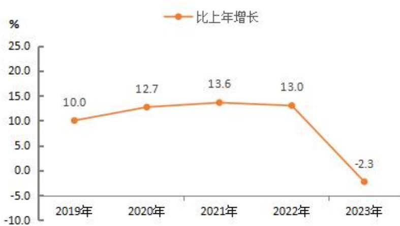
图 5 2019-2023 年固定资产投资增长速度

全年全县房地产开发投资 75138 万元，比上年下降 5.8%。其中，住宅投资 70534 万元，下降 7.2%。年末商品房待售面积 117253 平方米，比上年末减少 8516 平方米。年末商品住宅待售面积 95186 平方米，比上年末增加 8976 平方米。